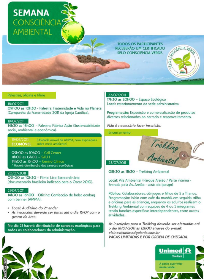
Figura 1. Exemplo de informativo.

Os colaboradores se mostraram bastante motivados e participaram ativamente da “Semana da Consciência Ambiental” assistindo a palestras, conforme programação da Figura 1, e se informando sobre atitudes ambientalmente responsáveis.