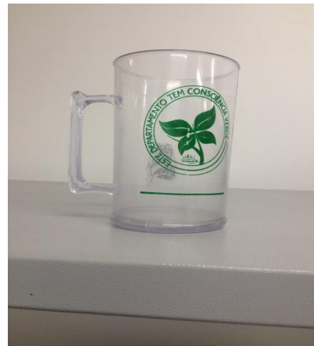
Figura 3 – Caneca entregue aos colaboradores