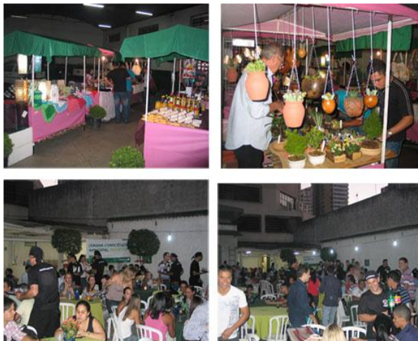
Figura 2 - Semana de Consciência Ambiental