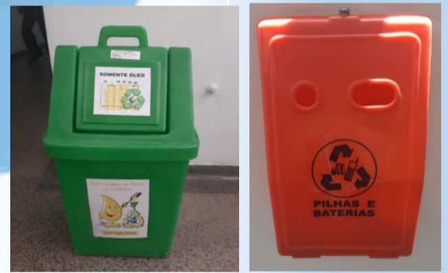
Local para descarte de óleo, pilhas e baterias