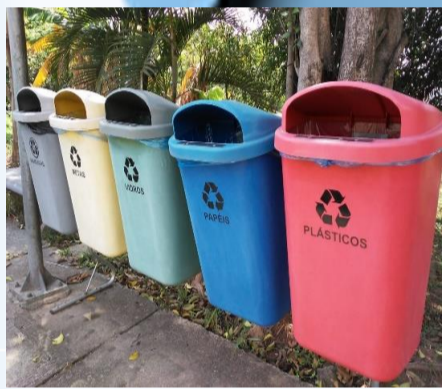
Lixeiras para descarte seletivo