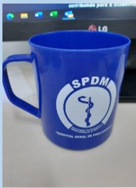
Caneca plástica para colaborador

No Hospital Geral de Pirajussara foram implantadas diversas ações, como: