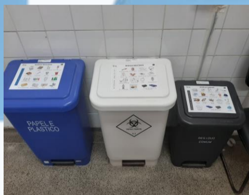
Lixeiras com descrição do que descartar