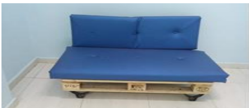
Poltrona confeccionada de palete e tecido.

Esse trabalho trouxe a todos, satisfação ao ver a concretização de um trabalho realizado em equipe. Alguns colaboradores desenvolveram a arte de trabalhar com os resíduos recicláveis, depois dos trabalhos realizados a motivação de outros colaboradores começaram a se manifestar. Continuaremos com o foco em reforçar a conscientização dos colaboradores em separarem os resíduos recicláveis para a elaboração de itens.