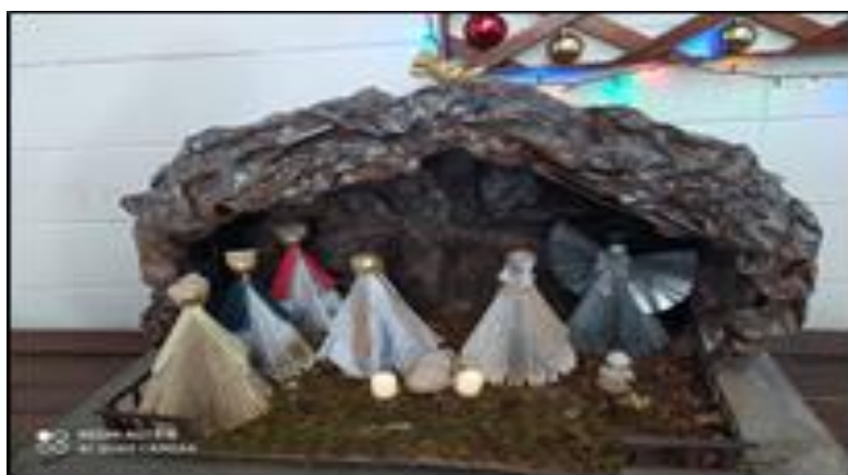
Presépio confeccionado com papel reciclável (envelopes inutilizados, amassados, riscados).

Motivar os colaboradores a reaproveitarem os resíduos recicláveis e decorar a unidade em eventos festivos. Conscientizar a importância do reaproveitamento dos resíduos recicláveis e a conservação do meio ambiente.