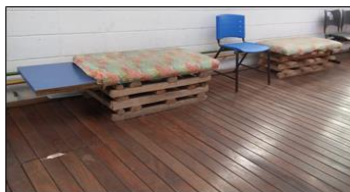
Poltronas confeccionadas de paletes e tecidos.