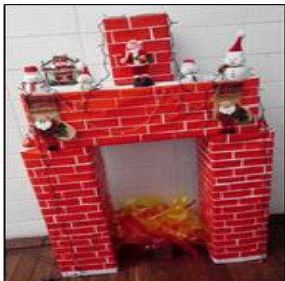
Confeccionada com caixas de papelão vazias.