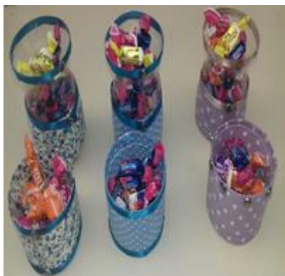
Potes Confeccionados com tecidos e garrafa Pet.