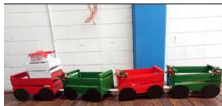
Confeccionado com o reaproveitamento caixotes de madeira.